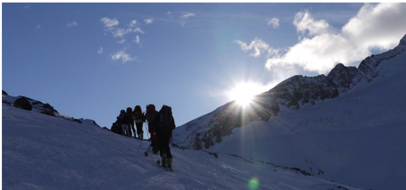
Bild des Monats: Sonnenaufgang am Grossvenediger NW Grat Aufnahmedatum: 30.03.2013