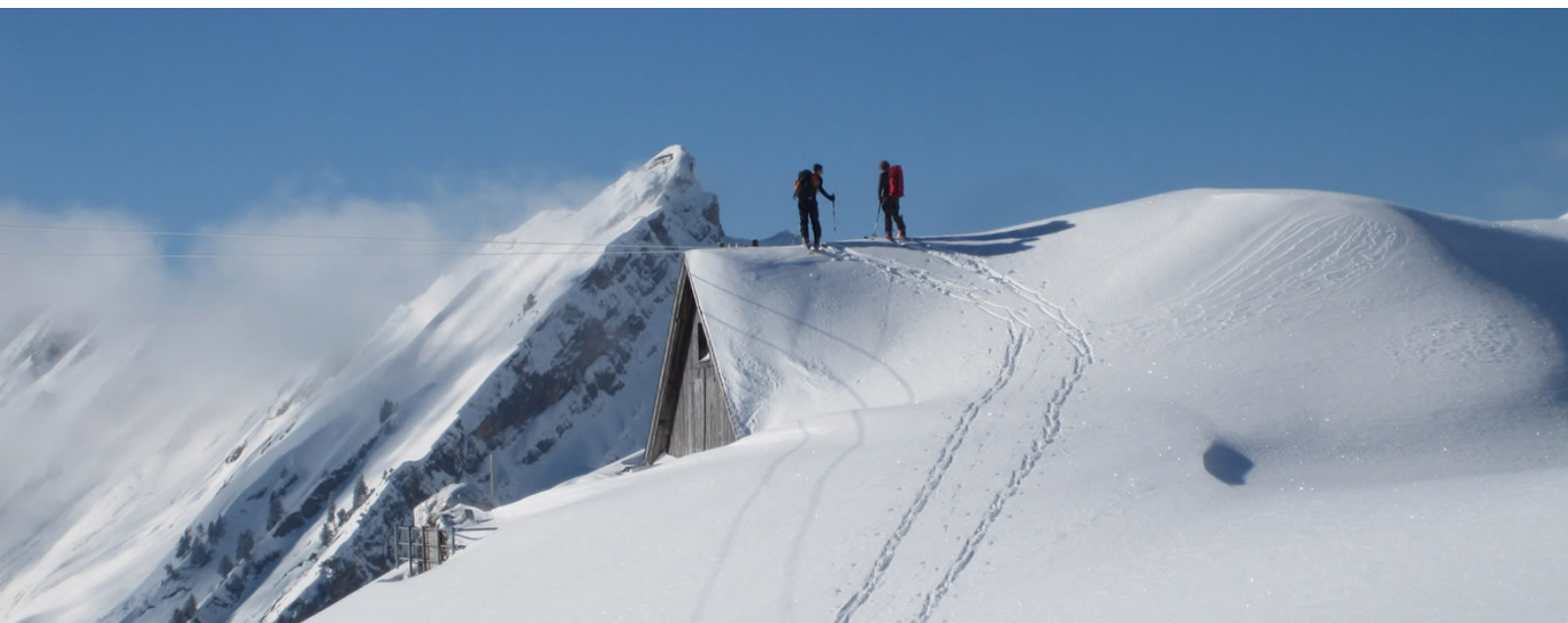
Bild des Monats: JO - Skitour Speer Aufnahmedatum: 12.1.2014