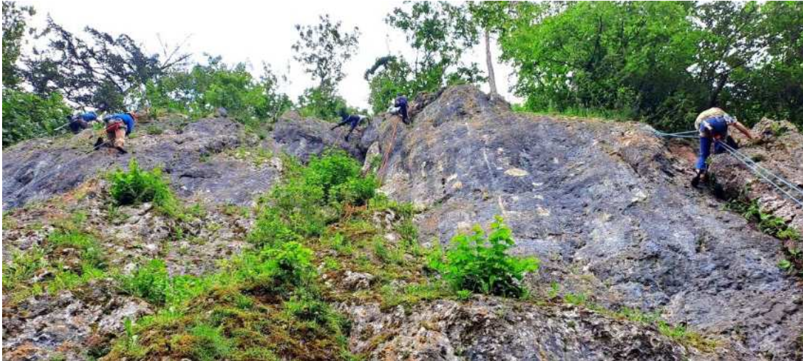
13 freiwillige Helfer am Fels