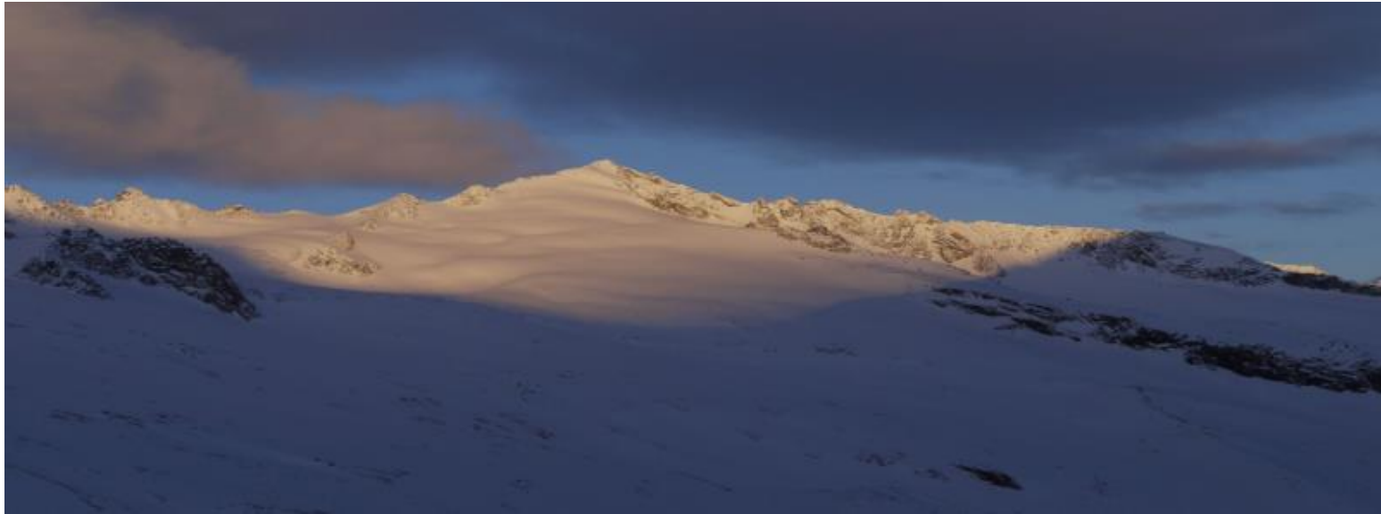
Bild des Monats Blick von der Kürsingerhütte auf den Schieferspitz, Hohe Tauern Aufnahmedatum: 30. März 2013