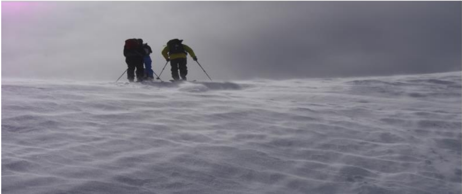
Bild des Monats Stürmische Verhältnisse kurz vor dem Gipfel des Silberens Aufnahmedatum: 28. Februar 2018