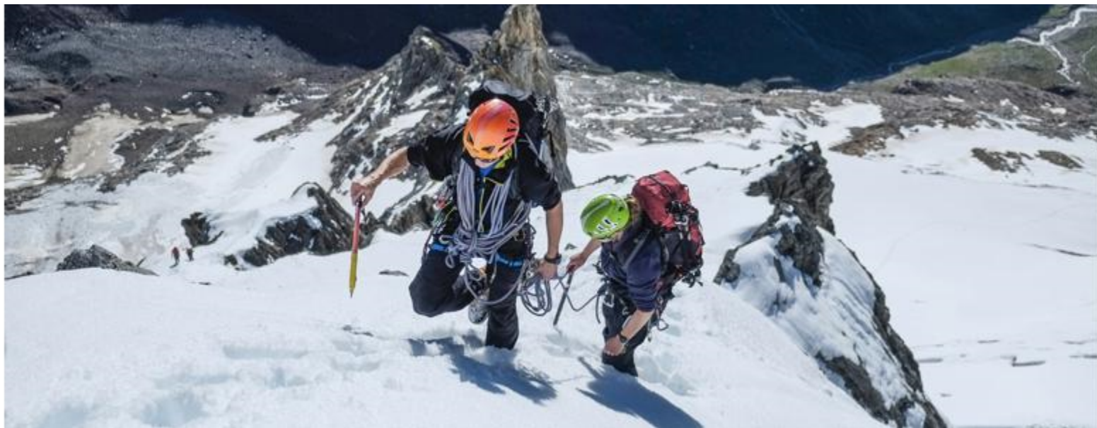
Bild des Monats: Sustenhorn Ostgrat, JO-Tour Aufnahmedatum: 15. Juli 2014