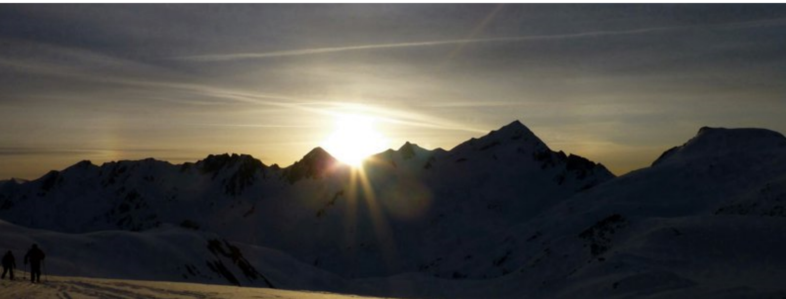
Bild des Monats: vom gross Leckihorn (bei der Skitour Rotondo) Aufnahmedatum: 11. -12. April 2015